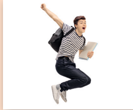
springen Ik kan springen.