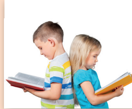
lezen Ik kan lezen.