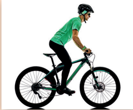
fietsen Ik kan fietsen.