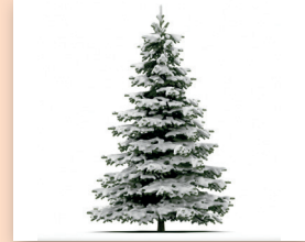
sneeuwen Het kan sneeuwen.

Let op: dit zijn ook werkwoorden, maar je kunt ze niet doen: zijn, worden.