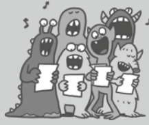
zingen Ze zingen.

doe-woorden = wat je kunt doen Doe-woorden kunnen gebruikt worden voor 1 persoon of voor verschillende personen. Hij kan vissen. Ze kunnen zingen.