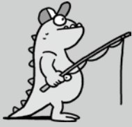
vissen Hij vist.

DOEL Ik kan doe-woorden herkennen en geven. Ik weet dat doe-woorden zich aanpassen aan de persoon of personen die erbij horen.